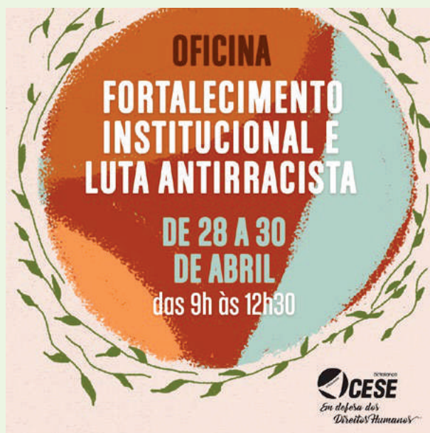
Material divulgação Oficina 2021

Do Racismo Fundiário ao Racismo Ambiental, a estrutura mantida é a mesma: situação permanente de opressão, anulação social, privação de direito e violência institucionalizada contra corpos e territórios negros e indígenas no Brasil.