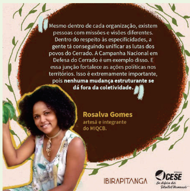
Depoimento de participante da Oficina de Fortalecimento Institucional 2021

Ameaças que foram intensificadas a partir de 2016, com o golpe político sofrido pela presidenta Dilma Rouseff, e com a ampliação e fortalecimento político de extrema direita composta, sobretudo, por políticos ligados à bancada ruralista, que passaram no governo do então presidente Jair Bolsonaro a incidir mais diretamente sobre o arcabouço institucional do Estado e assim promover um desmonte na legislação ambiental, atendendo aos interesses do agronegócio brasileiro.