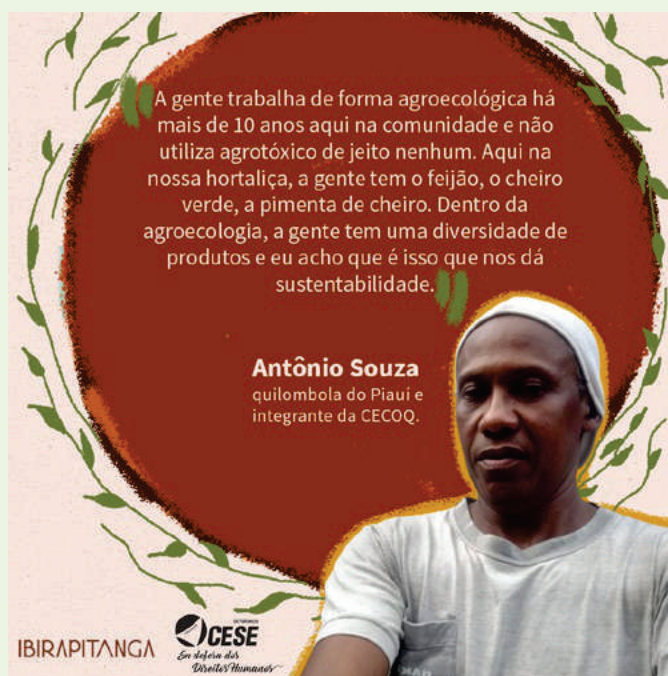
Depoimento de participante da Oficina Sistemas Alimentares e a luta antirracista 2021

A agroecologia é uma política emancipatória dos territórios , que permeia a produção de alimentos como respeito social e ecológico. E se referencia nos conhecimentos tradicionais e na diversidade étnico-cultural e modos de vida dos povos originários e quilombolas. Uma ação concreta de resistência, à medida que estimula a organização social e produtiva dos agroecossistemas, principalmente de mulheres e juventude, por meio do trabalho justo e da geração de renda.