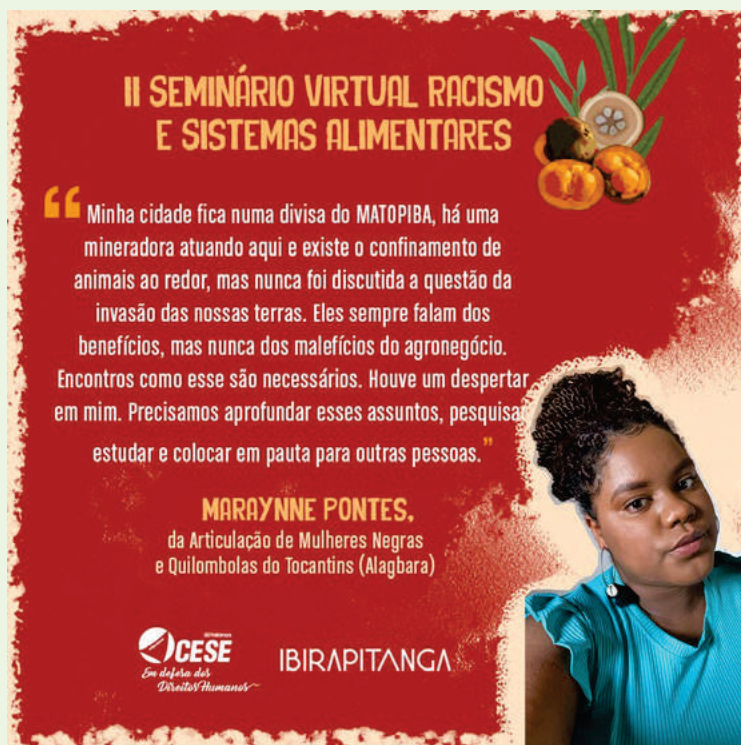
Depoimento de participante do II Seminário Virtual Racismo e Sistemas Alimentares 2022

Contudo, ainda é um desafio garantir a presença e participação efetiva das juventudes nos territórios com condições de participação nas organizações sociais, acessando direitos que possibilitem a permanência em seus territórios e a manutenção de suas práticas culturais.